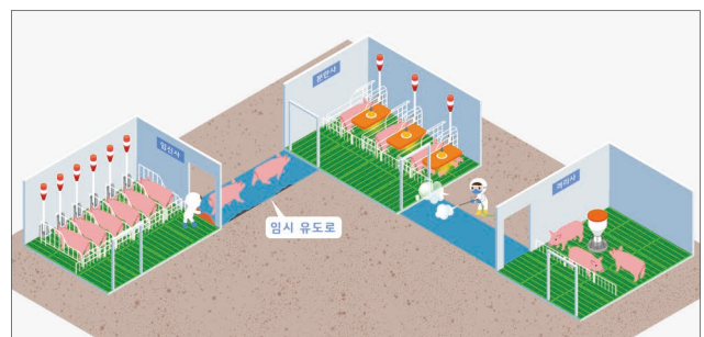
② 포장된 유도로가 없는 경우