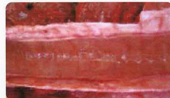
기관 내 병변