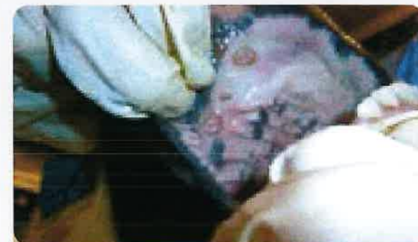
구강 내 궤양성 병변