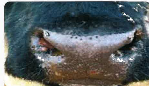
주둥이 및 입술의 궤양성 병변